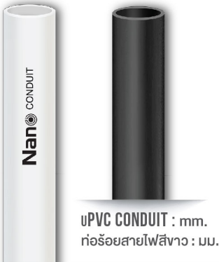
uPVC CONDUIT : mm. ท่อร้อยสายไฟสีขาว : มม.

JIS C8430 (มาตรฐานญี่ปุ่น) BSEN 50086-21:1996 (มาตรฐานอังกฤษ)